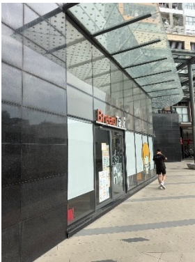
(S1 入口在 breadtalk 旁)

1. 於 Sun Avenue 大樓的 S1 棟右手邊 Office 入口進入(請不要走到 apartment 的入口)，當天會有試場人員帶領上樓)。